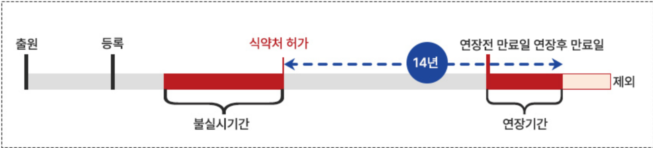
<개정 시 연장된 특허권 존속기간 상한(캡) 적용례>

하나의 허가 등에서 연장 가능한 특허권 수를 1개로 제한하였습니다(특허법 제90조 제7항 신설 등).